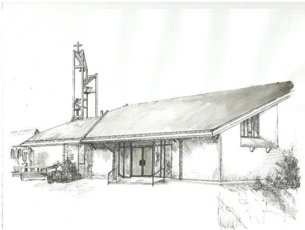
(pentekening gemaakt door Herman Schouwaerts, voorzitter)

MAANDBLAD W A V N D B G V D SEPTEMBER 2017 S E P T E M B E R 2017