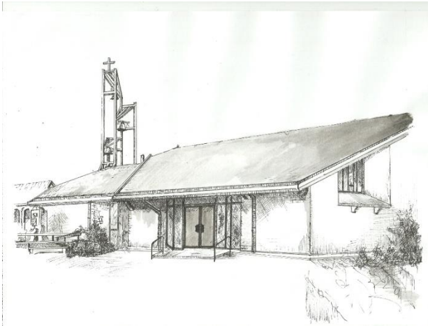
(pentekening gemaakt door Herman Schouwaerts, voorzitter)

MAANDBLAD MAANDBLAD DECEMBER 2017 DECEMBER 2017