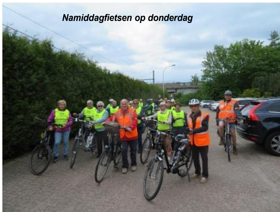
Namiddagfietsen op donderdag