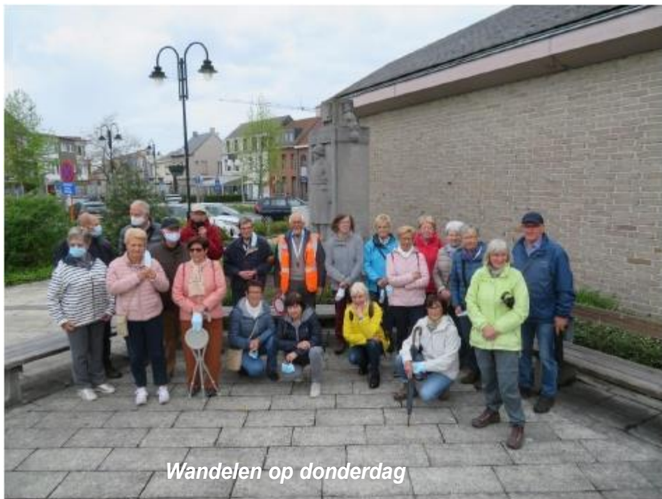
Wandelen op donderdag